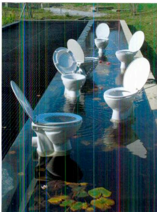
WC-Schüsseln illustrieren den Wasserkreislauf im Wassergarten vor dem Eawag-Hauptgebäude Forum Chriesbach.

Kunst und Wissenschaft. Die Eawag hat sich zum zweiten Mal an diesem Programm beteiligt.