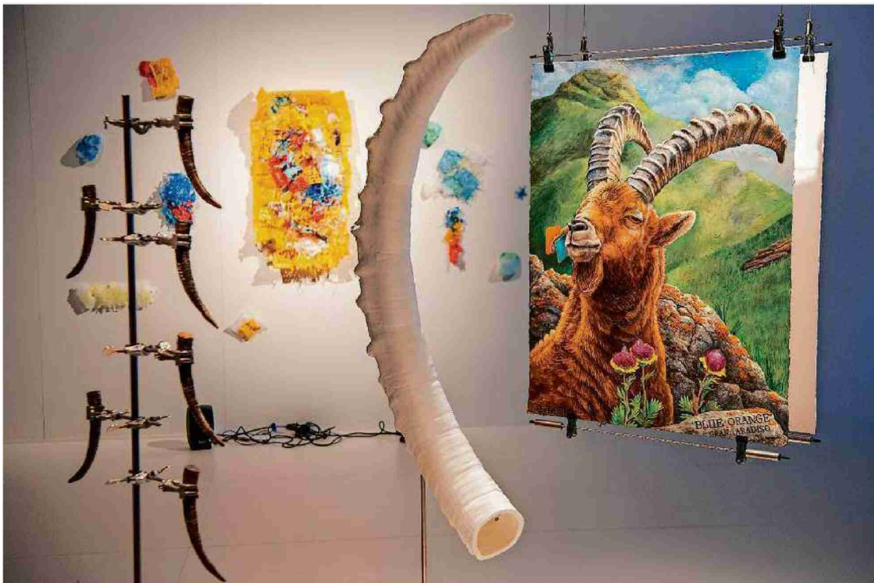
Installationen, Skulpturen und Bilder: In der Schau im Nationalparkzentrum in Zernez sind Werke von Magda Drozd, Nicola Genovese, Edward Monovich und Aurélie Strumans zu sehen.

«Entführungen – Kunst, Wissenschaft und die DNA des Steinbocks». Bis 21. Oktober 2018. Nationalparkzentrum, Zernez. Weitere Informationen unter www.nationalpark.ch .